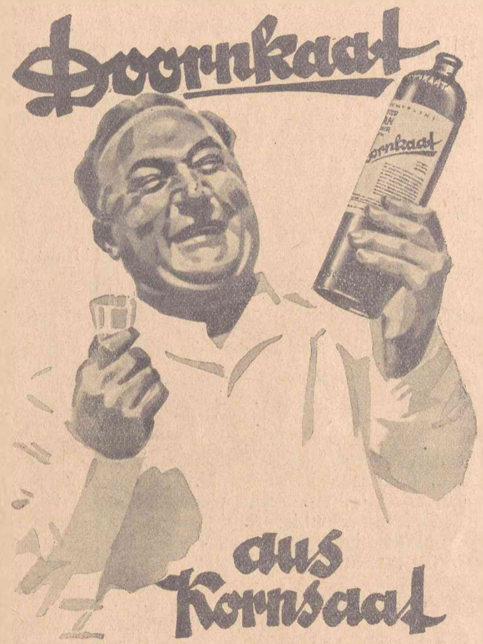
Boornkaat, Bittlingengesellschaft, Norden i. Ostfriesland Deutschlands größte Kornbrennerei, gegründet 1806