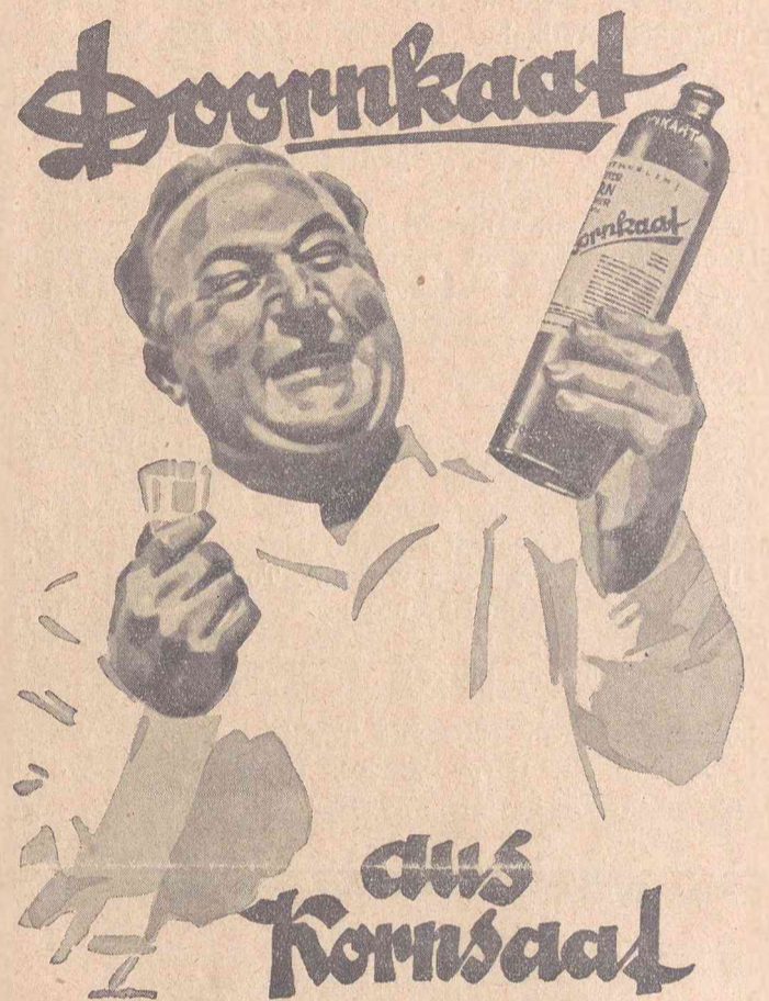
Kornsaat-Produktionsgesellschaft Norden i. Ostfriesland, Deutschlands größte Kornbrennerei, gegründet 1806