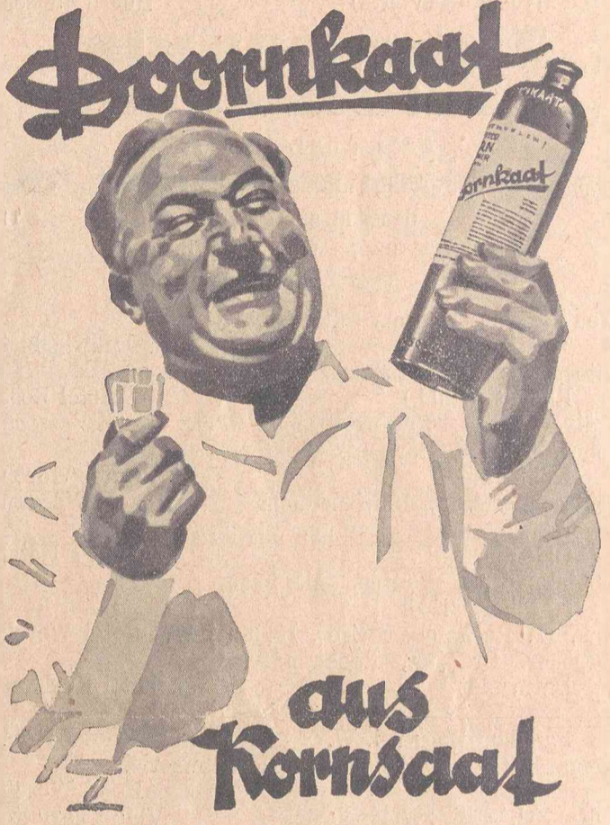
Doornkaat Aktien-Gesellschaft Norden i. Ostfriesl. Deutschlands größte Kornbrennerei, gegründet 1806