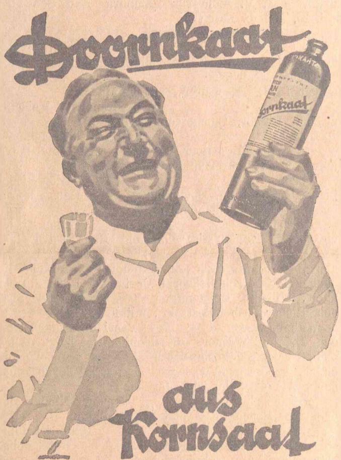
Kornsaal-Produktionsgesellschaft Norden i. Olfriesland. Deutschlands größte Kornbrennerei, gegründet 1806