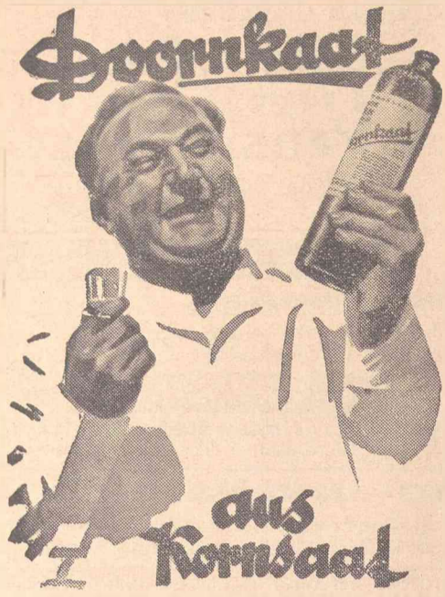
Doornkaat Bittergeest J. J. van der Vliet Doornkaat Bittergeest J. J. van der Vliet Doornkaat Bittergeest J. J. van der Vliet

Besitzer Heinrich Haase / Fernsprecher 101 Vornehmes Haus in nächster Nähe der Post und des Badestrandes. Vorzüglicher Mittagstisch. Große Abendkarte. Behag- liche Restaurations-Räume. Weine erster Häuser, gut gepflegte Biere.