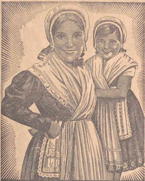
Die Winzerin von Rhein und Mosel

Hauptschriftleiter: Otto G. Soltau, Norden. Verantwortlicher Anzeigenleiter: Otto G. Soltau, Norden Druck und Verlag: Otto G. Soltau, Norden. D.-A. Juni 1937: 330 Preisliste Nr. 2 vom 1. 6. 37 ist gültig